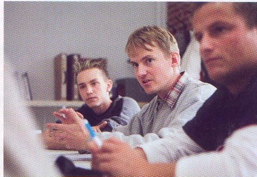
Diskussionsforum statt Frontalunterricht: Eigeninitiative gehört zum Schulkonzept