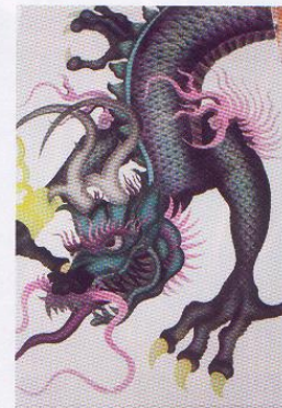
Der Drache als Hinterglasmalerei ist ein Beispiel für die Kreativität der Meisterschüler